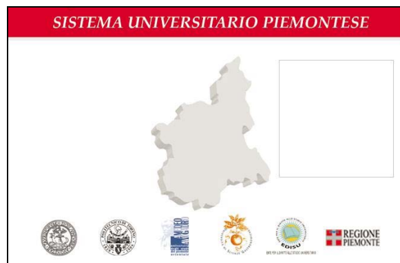
Fig. 1. Esempio di smart card distribuita dal Politecnico al personale

Pertanto tale card dovrà essere utilizzata dal concessionario per la fornitura del servizio sostitutivo di mensa.